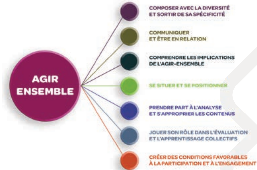
Figure 3 – Aide mémoire sur les compétences essentielles à l'agir-ensemble

Le chantier sur le développement des compétences a décidé de porter son regard sur les compétences essentielles à l'agir-ensemble au sein d'un système d'action concertée (SAC). Cinq fonctions occupées par les acteurs des SAC ont été mises en lumière afin d'arriver à préciser les compétences essentielles à chacune. Il est ressorti que les compétences de participation auraient avantage à être maîtrisées par l'ensemble des individus prenant part aux activités d'un SAC, quelle que soit leur fonction.