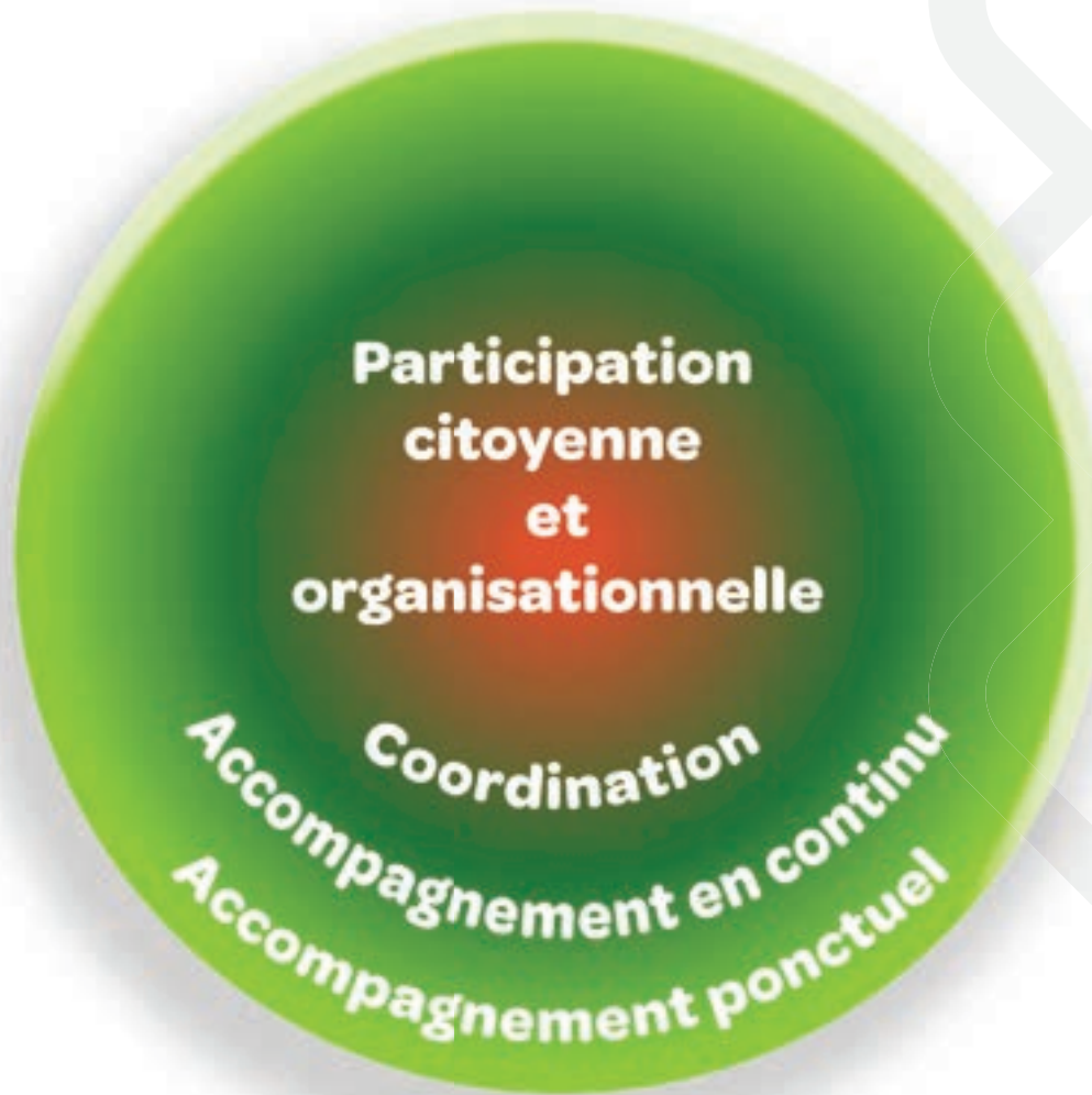
Figure 2 - Illustration des fonctions dans un système d'action concertée

tions retenues figurent dans la figure ci-dessous. On doit ici comprendre que le cœur d'un SAC est constitué de la fonction de participation (citoyenne ou organisationnelle), à laquelle s'ajoute celle de coordination et finalement d'accompagnement (en continu ou ponctuel). La figure montre que les frontières sont fluides entre les fonctions, ce qui tient compte qu'un même acteur peut parfois naviguer entre deux fonctions. La figure témoigne également de cette capacité collective recherchée qui est celle de coconstruire, de mailler les expertises et d'agir en intersectorialité.