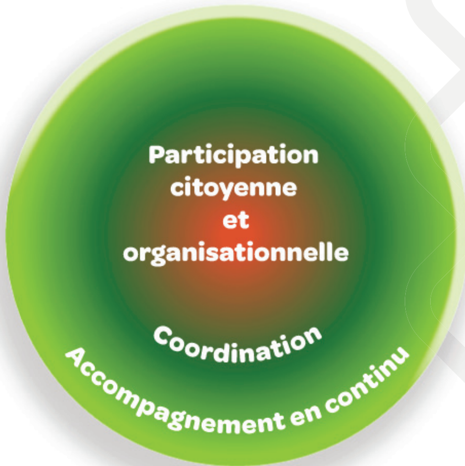
Figure 2 - Illustration des fonctions dans un système d'action concertée

tions retenues figurent dans la figure ci-dessous. On doit ici comprendre que le cœur d'un SAC est constitué de la fonction de participation (citoyenne ou organisationnelle), à laquelle s'ajoute celle de coordination et finalement d'accompagnement (en continu ou ponctuel). La figure montre que les frontières sont fluides entre les fonctions, ce qui tient compte qu'un même acteur peut parfois naviguer entre deux fonctions. La figure témoigne également de cette capacité collective recherchée qui est celle de coconstruire, de mailler les expertises et d'agir en intersectorialité.