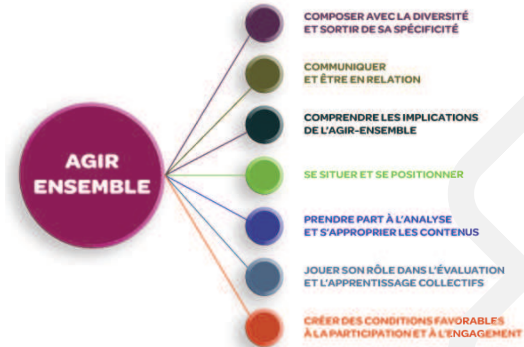
Figure 3 – Aide mémoire sur les compétences essentielles à l'agir-ensemble

Le chantier sur le développement des compétences a décidé de porter son regard sur les compétences essentielles à l'agir-ensemble au sein d'un système d'action concertée (SAC). Cinq fonctions occupées par les acteurs des SAC ont été mises en lumière afin d'arriver à préciser les compétences essentielles à chacune. Il est ressorti que les compétences de participation auraient avantage à être maîtrisées par l'ensemble des individus prenant part aux activités d'un SAC, quelle que soit leur fonction.